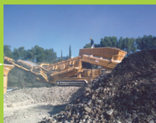
Opération de tri et de valorisation d'éléments ferreux par broyage, triage, concassage.