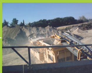
Opération de concassage et de criblage, scalpage puis lavage.