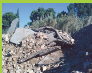
Travaux de démolition d'ouvrages en béton armé, déconstruction de voirie.

Vente de terres végétales et agrégats aux entreprises, collectivités, particuliers