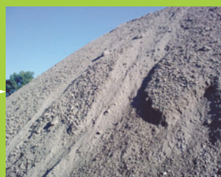
Matériaux de remblais Type GNT 0/100-0/80-0/60-0/30-0/20. Drainage 20/40-60/80. Sable, terre végétale.

Vente de terres végétales et agrégats aux entreprises, collectivités, particuliers