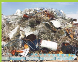
Matériaux plastiques, bois, métaux, mise en bennes de chantier.

Vente des agrégats aux entreprises de BTP