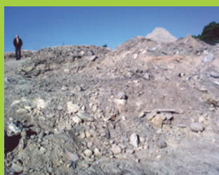
Décapages de terres, matériaux calcaires issus de chantiers de terrassement.