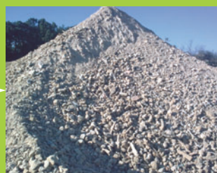
Matériaux de remblais et réutilisables dans la fabrication des enrobés.

Vente des agrégats aux entreprises de BTP