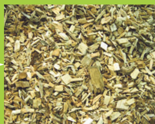
Revente aux industries chimiques, à l'industrie du bois.