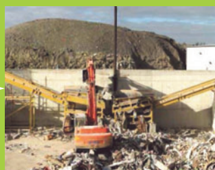
Tri mécanique et manuel des matériaux, broyage, stockage.